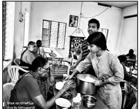
Shot on OnePlus